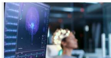
Comisión de investigación científica

Democratizar el acceso a estos conocimientos es uno de los objetivos del instituto y por ello hemos creado dos programas para llevar a centros educativos.