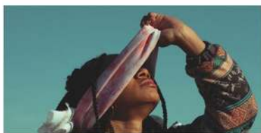
Comisión de investigación para personas con ceguera

Desde Intuitu sabemos que si ver sin los ojos es posible, todavía hay mucho por descubrir acerca de la percepción, la intuición y la consciencia. Por esto hace un tiempo creamos tres comisiones de investigación: