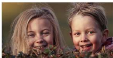
Comisión de investigación para la educación

Realizamos sesiones gratuitas a personas con diversidad visual y entre un equipo de coach elaboramos nuevas propuestas para seguir avanzando.